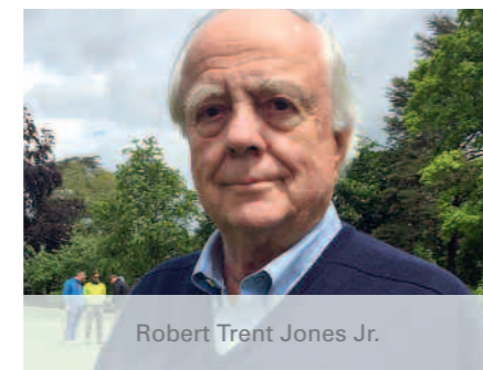
Robert Trent Jones Jr.