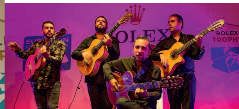
Rythmes effrénés avec Chico & The Gypsies.