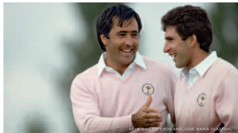
SEVE BALLESTEROS AND JOSE MARIA OLAZABAL