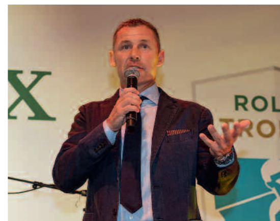
Tom Kristensen, pilote automobile et Ambassadeur Rolex, a captivé les invités présents à la soirée.

gour à la libanaise, crémeux au yaourt grec, crème catalane vanillée... Un tour des saveurs qui chantent le chaud soleil du sud. Pour donner encore plus de couleurs à la soirée, les rythmes endiablés et gitans de Chico & The Gypsies ont fait tourner les têtes et les cœurs. Au Rolex Trophy, chaque soirée est inoubliable.