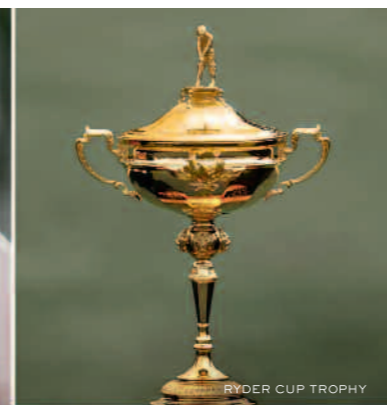
RYDER CUP TROPHY