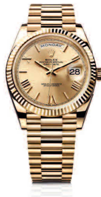
OYSTER PERPETUAL DAY-DATE 40

This watch is a witness to Europe's finest vs. America's best. Worn on the wrists of those who place teamwork and the pride of a continent above all else. It doesn't just tell time. It tells history.