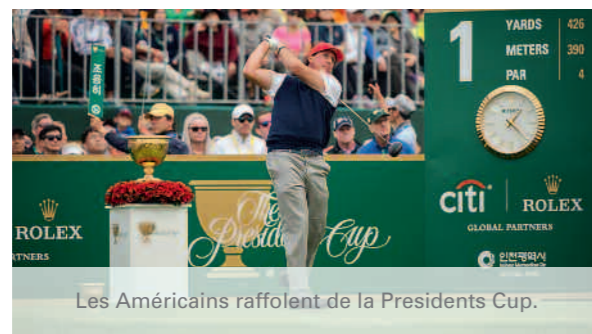
Les Américains raffolent de la Presidents Cup.

Bien que la grande majorité de ses tournois se disputent en individuel, le golf est aussi un sport par équipes. Dans le monde professionnel, trois grandes compétitions internationales et bienales dominent les autres: la Ryder Cup, match Etats-Unis vs Europe (fin septembre à Minneapolis), la Presidents Cup, match Etats-Unis vs Reste du monde (hors Europe), et la Solheim Cup, autre face-à-face Europe vs Etats-Unis du côté féminin. Ces compétitions sont